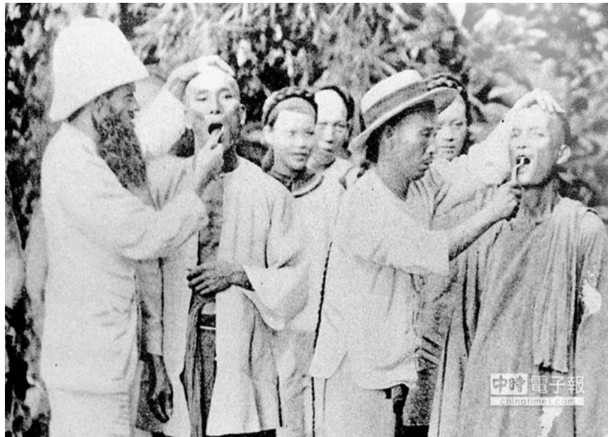
馬偕牧師位民眾拔牙

馬偕常常和助手利用巡迴傳道之際，深入平埔族、熟蕃、南勢蕃、生蕃區住的村落，為病患拔牙，據馬偕自述由1873年起為台灣人共拔除二萬一千餘齒。