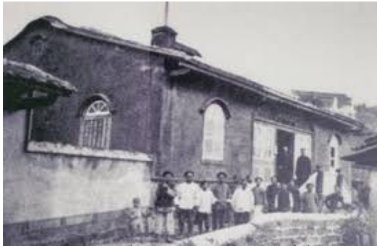
偕醫館（馬偕紀念醫院的前身）